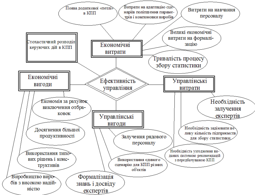
Рис. 2 – Концептуальна модель ефективності управління конструкторською підготовкою виробництва електронного апарату

На рис. 2 приведена концептуальна модель ефективності управління конструкторською підготовкою виробництва електронного апарату. На рис. 2 не показані атрибути об’єктів, оскільки маємо справу з управлінням конструкторською підготовкою виробництва електронного апарату, в якому виділено декілька рівнів організації, кожний з яких включає елементи з різних рівнів, тому детально відносини пояснені в описі концептуальної моделі системи підтримки прийняття рішень.