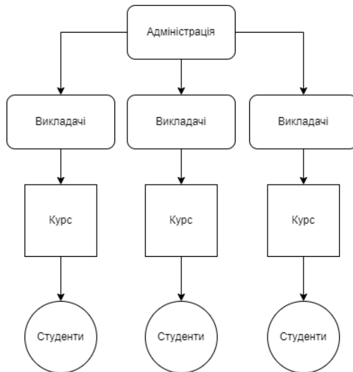
Рисунок 3. Гібридна модель управління LMS

При такому підході, адміністрація займається переважно технічними питаннями та регулюванням загального функціоналу системи, в той час як викладачі налаштовують курси та їх структуру персонально під кожну навчальну програму.