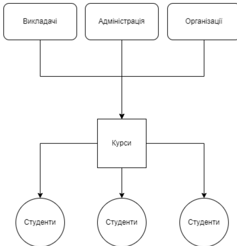
Рисунок 2. Децентралізована модель управління LMS

При децентралізованому підході, функціонал системи розподілено між різними групами користувачів та відповідальних осіб. Наприклад, між різними відділами: відділ технічного обслуговування, відділ створення курсів, відділ модерації контенту, відділ зворотного зв'язку тощо.