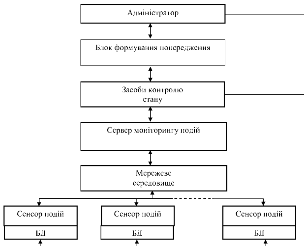
Рис. 1 – Архітектура моделі моніторингу подій на основі сенсора подій

На рисунку 1 зображено схему, яка була створена на основі розробленої моделі.